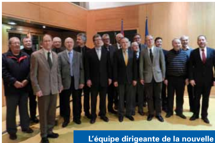
L'équipe dirigeante de la nouvelle Communauté des Communes

Après plus d'une année de préparation les Communautés des Communes de Thann et de Cernay ont fusionné le 1 er janvier 2013.