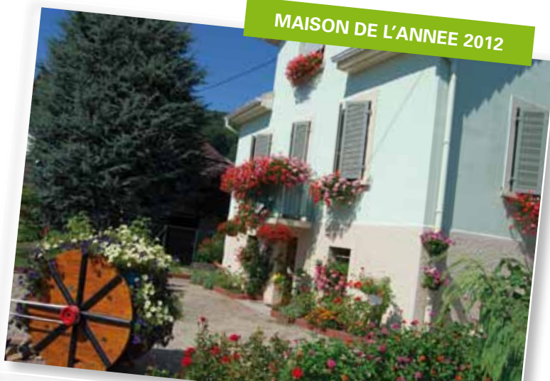
MAISON DE L'ANNEE 2012

Plus que les mots laissons parler les images et le langage des fleurs.