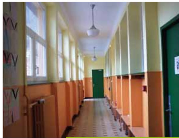
COULOIR « ÉCOLE DES FILLES »

La totalité de ces travaux s'élève à 342 220 €